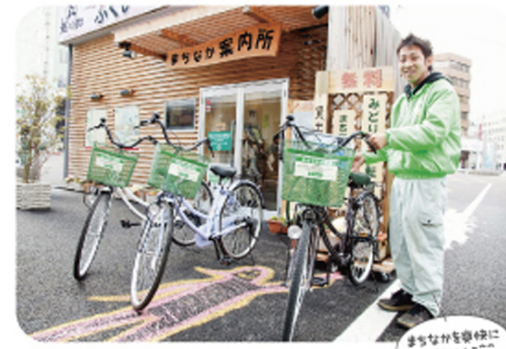
まちなかを春先に駆け抜けよう♡

キュートだけど、どこかひときわさえる服や小物が並び「カゲキ屋雑貨店」は、愛されて開店14年。アメリカやイギリスなどの貴重なピンテージ品がそろっている。この春は、トップスにパンツやタイトなスカートに合わせて、コーディネートを楽しんで♪