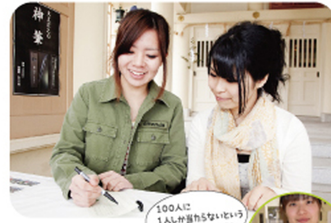
100人に1人しか当らないという『アソビ魂』を届けてよう!

フィーリング(感じる)力をサポートする緑色 心にも時間にも余裕がないと感じる時には森林浴やハーブアロギングなどグリーンを身近に感じることが大切です。オーラソーマではグリーンは「スペース」の意味があります。空間や場所ではなく、何かを感じ取るスペースや自分自身を知る色のスペースの事。心の中にゆとりがないと精神的になって置かないで済ませません。グリーンは心臓に反応する色であり感じる力をサポートして気持ちを元気づけてくれる色なのです。